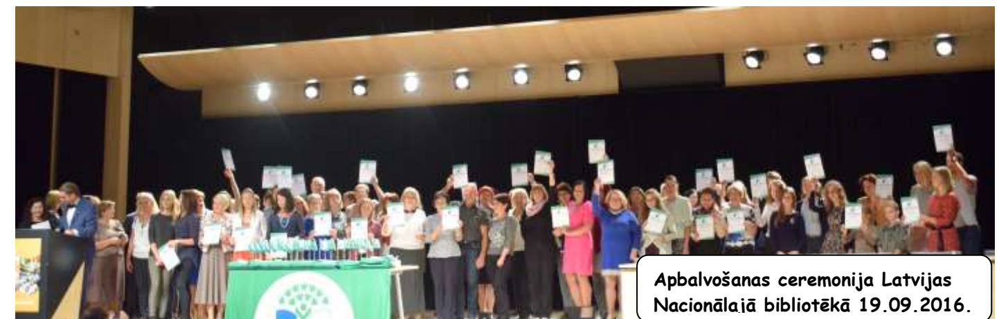
Apbalvošanas ceremonija Latvijas Nacionālajā bibliotēkā 19.09.2016.

Mūsu izvēlētā 2016./2017.mācību gada tēma - enerģija. Uzdevumi- sekmēt priekšstatus par enerģiju, tās nozīmi, iegūšanu, pārveidošanu, izmantošanu un par šo procesu sekām, rosināt taupīgi, efektīvi izmantot enerģiju.